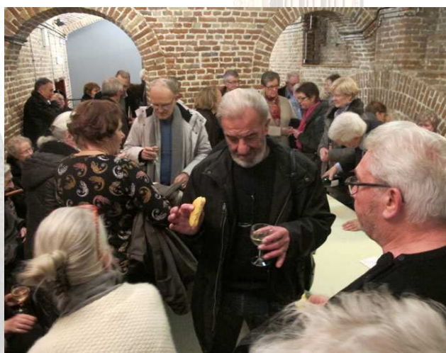
Le pot de l'amitié

Siège : 21, rue de la délivrance 62400 Béthune Contact : 09 52 94 51 60 Courriel : amisdumusee.bethune@orange.fr Site Internet : www.amisdumusee-bethune.fr