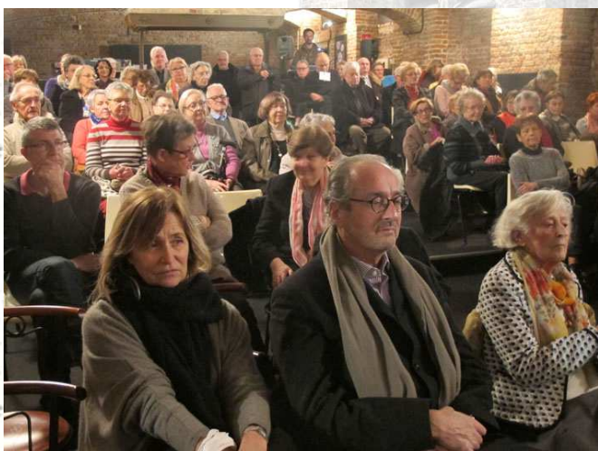
Vue partielle de l'assistance